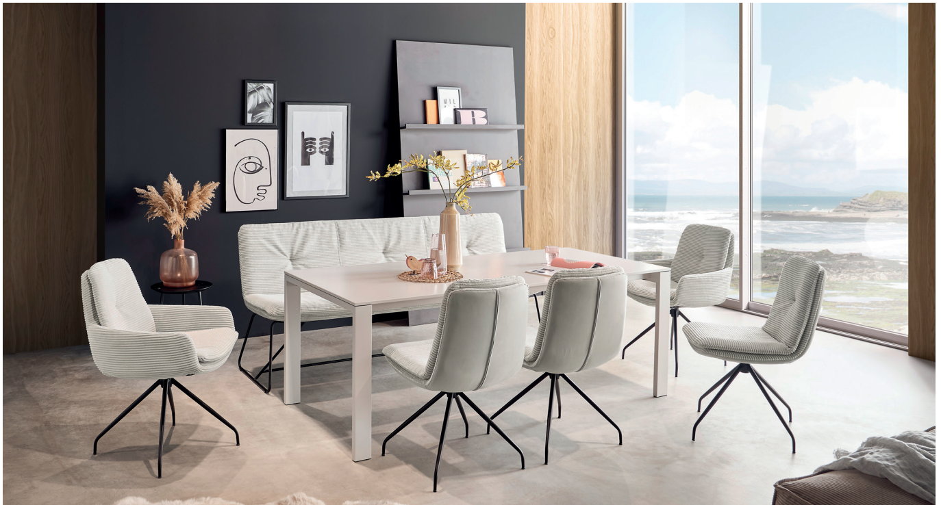
Solobank, Stühle und Armlehnenstühle