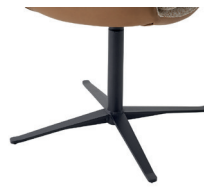
1071 Viersternfuß drehbar schwarz matt (gegen Aufpreis)