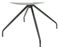
991 Spinnenfuß drehbar schwarz matt (gegen Aufpreis)