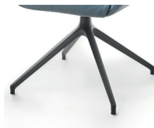
1016 Spinnenfuß drehbar schw. matt strukt. (gegen Aufpreis)