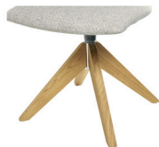
994 Spinnenholzfuß drehbar Eiche geölt (gegen Aufpreis)