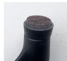
Filzgleiter (gegen Aufpreis)