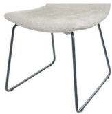
1095 Metallgestell schwarz matt Standard