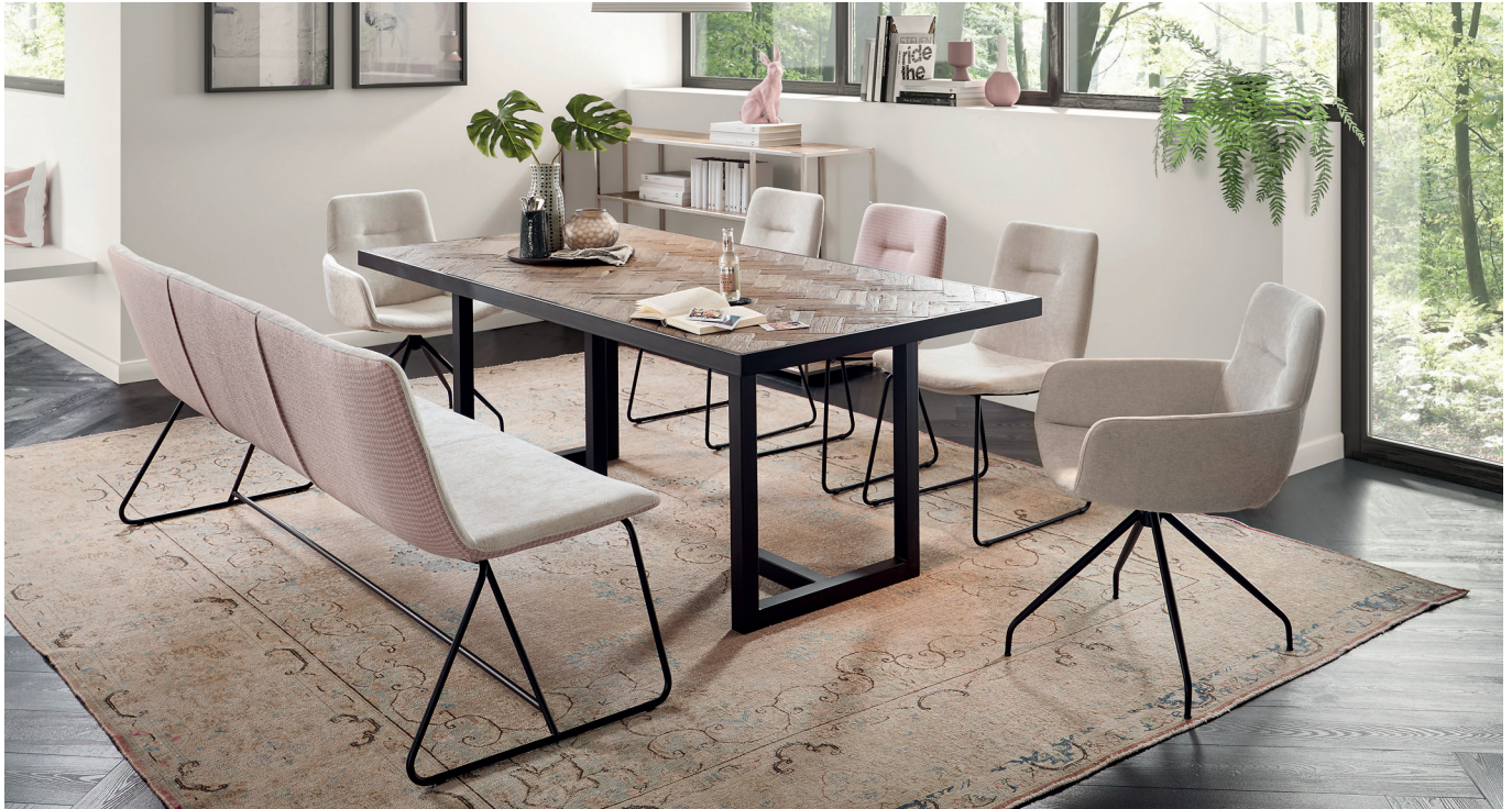
Solobank, Stühle und Armlehnenstühle